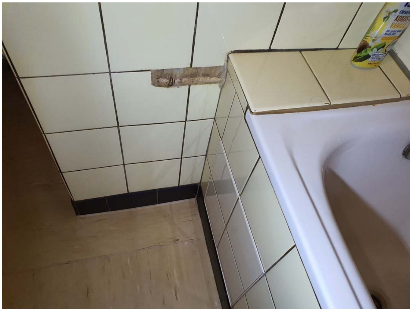
— 20260511_142742.jpg —